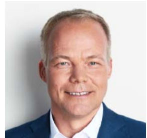
Dr. Matthias Miersch SPD-Bundestagsabgeordneter

Für das weitere, erfolgreiche Fortbestehen brauchen wir auch Ihre Unterstützung!